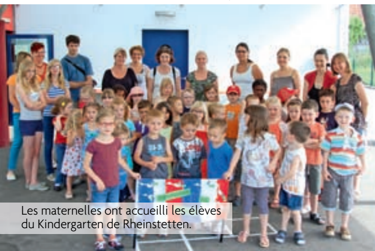
Les maternelles ont accueilli les élèves du Kindergarten de Rheinstetten.

De même les petits de la maternelle ont partagé une journée à Mittelhausen avec ceux d'un Kindergarten de Karlsruhe. Une visite de la ferme Goehry, un repas pris en commun sous le préau de l'école a permis de resserrer les liens entre les 2 groupes. Les enfants gardent de ces rencontres un très bon souvenir, et les correspondants allemands ont été très enthousiastes de leur journée en Alsace.