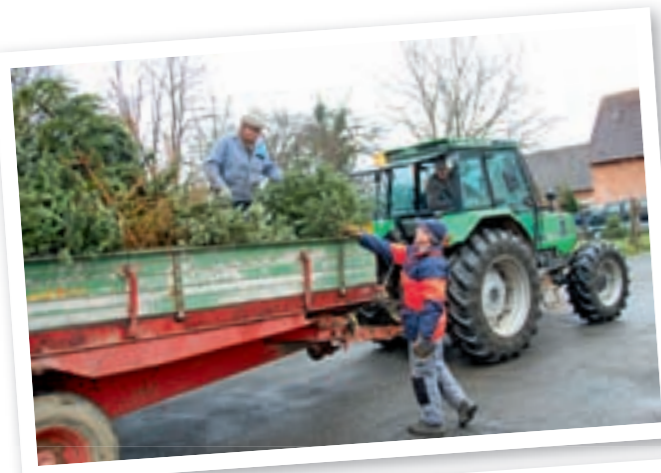
Comme chaque année une délégation du conseil municipal a fait le tour du village pour ramasser les sapins en fin de vie...