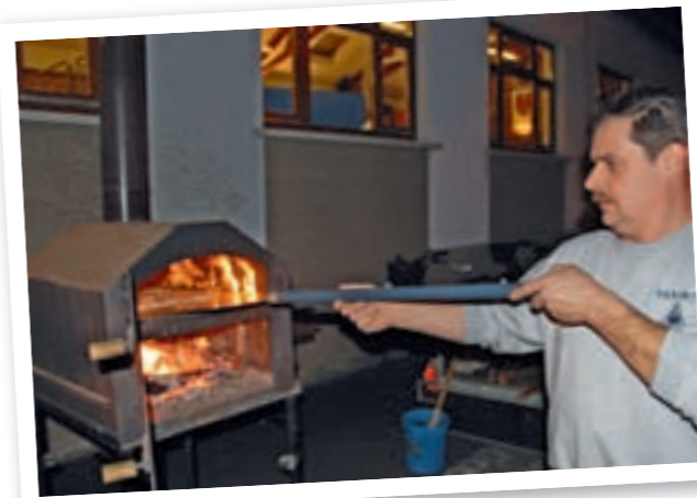
Les deux soirées du Don du sang ont rassemblé les donneurs qui après leur acte de générosité ont pu profiter des tartes flambées proposées par l'équipe communale bénévole pour reprendre des forces. Et la relève est assurée : plusieurs premiers dons ont eu lieu. Merci à ces jeunes qui sont venus donner leur sang au profit de personnes malades.