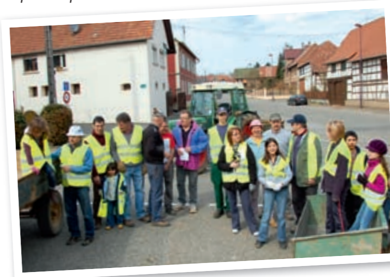
Préserver l'environnement et garder le ban communal « propre » reste la préoccupation d'un certain nombre de villageois, jeunes et moins jeunes, qui n'ont pas hésité à donner de leur temps, pour ramasser tout ce qui ne devrait pas se trouver dans la nature.