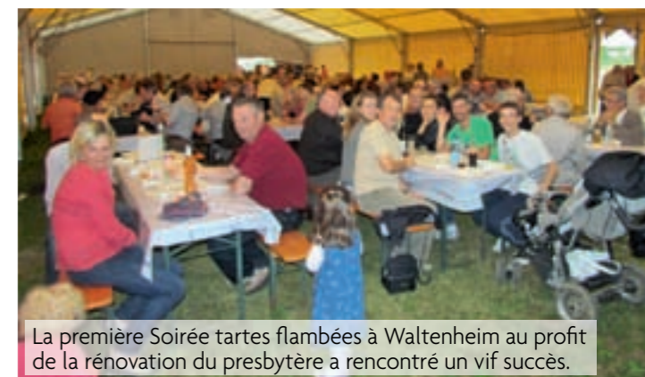
La première Soirée tartes flambées à Waltenheim au profit de la rénovation du presbytère a rencontré un vif succès.

Et bien sûr le traditionnel repas paroissial à Mittelhausen le 18 novembre a rassemblé tous les amis de la paroisse venus de près et de loin autour d'une choucroute royale.