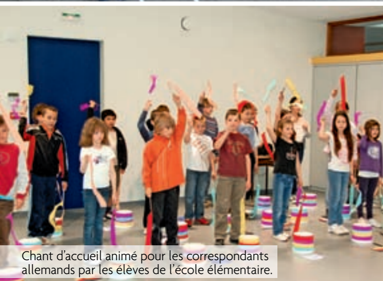
Chant d'accueil animé pour les correspondants allemands par les élèves de l'école élémentaire.

Pour les 3 cycles, le projet d'école était orienté sur la découverte du temps.