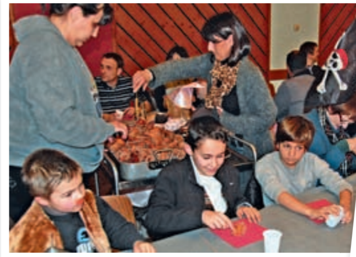
Le carnaval a rassemblé les enfants de Mittelhausen et des alentours qui ont animé les rues du village un dimanche de mi-février. Après la cavalcade, les enfants ont pu déguster à la Salle des Fêtes beignets et chocolat préparés par l'ASLM.