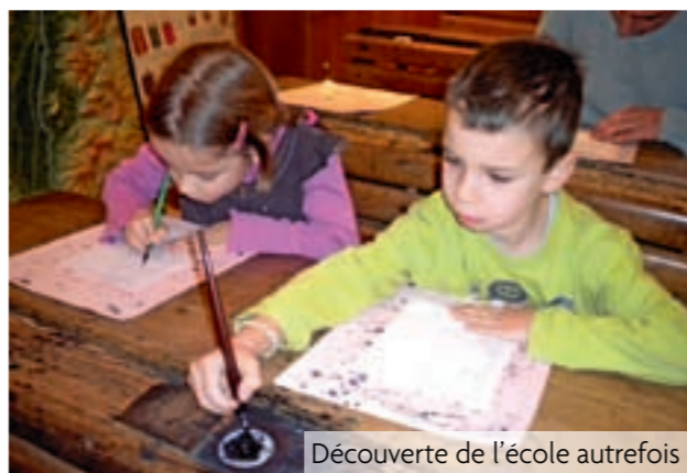
Découverte de l'école autrefois

Au cycle 1, les élèves ont observé le temps qui passe à travers leur histoire personnelle, de la naissance à aujourd'hui. Ils ont également côtoyé la grande