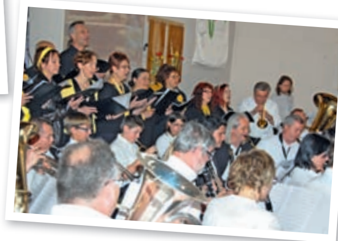
Moment culturel fort de notre commune : le concert de printemps à l'Église. Les choristes du Chœur Mille et une Notes et les musiciens de l'EMI ont mis en commun leur compétence et nous ont fait passer une après-midi musicale de qualité.