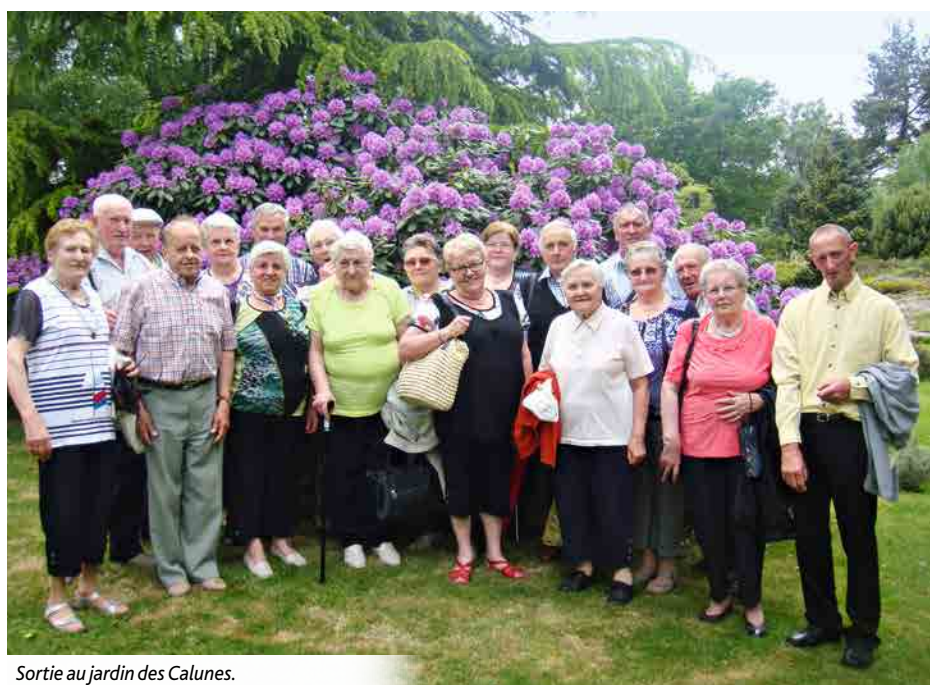
Sortie au jardin des Calunes.